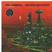
GLOBAL SURVEYOR „phase II“