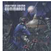
IMATRAN VOIMA „Commmmando“