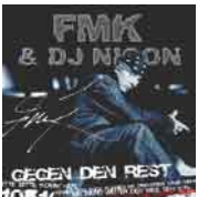
FMK & DJ NICON „Gegen den Rest“