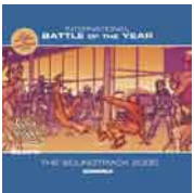
International Battle Of The Year (BOTY) The Soundtrack 2005